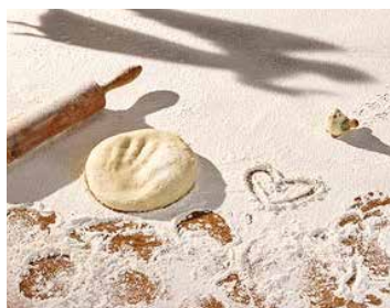
Le pain de Marie. Installation de Johnathan Watts avec les collections du MEG.