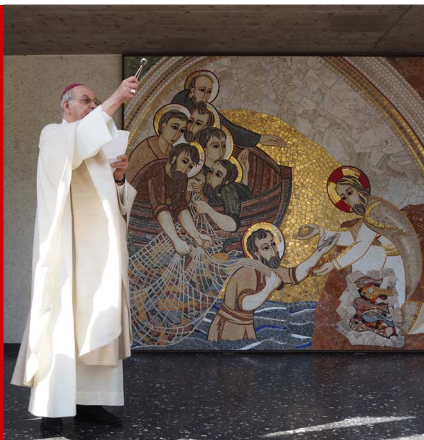
Bénédiction d'une mosaïque par Mgr. Pierre Farine

Le service développement & communication de l'ECR est un véritable service transversal. Il assure la double tâche de recherche de fonds auprès des catholiques genevois et gestion de la communication et de l'information. Les relations avec les paroisses et les services de l'ECR sont assurés par l'ensemble du service. La responsable de l'information est également la porte-parole de l'ECR et assure les relations avec les médias.