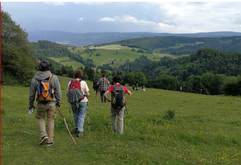
Stand de l'Oasis (en haut à gauche), repas convivial à l'Oasis et randonnée dans le Jura.