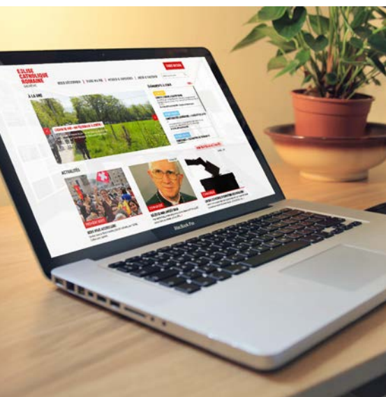
Nouveau site internet

La mise en place de ce nouveau site fut accompagnée d'une refonte en profondeur de notre image avec la création d'un nouveau logo, d'une nouvelle charte graphique afin de mieux s'adresser aux catholiques genevois et moderniser notre image. Cette nouvelle charte s'applique également aux services et aux paroisses afin de créer un ensemble cohérent et qui « parle » la même langue.