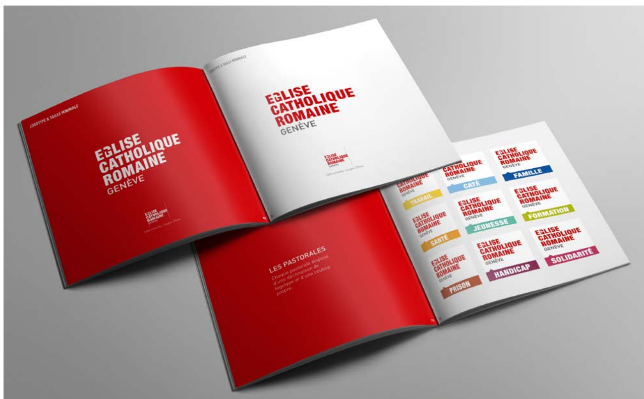
Nouvelle charte graphique

En parallèle de ces activités, les missions de recherches de fonds par voie de marketing direct et auprès des grands donateurs (institutions et personnes physiques) n'ont pas cessé, au contraire. Malgré l'effort déployé, comme pour toute structure qui vit de dons, ils sont en diminution. Les appels pour souligner l'urgence de la situation ont été nécessaires et heureusement entendus, ce qui a permis de limiter finalement la baisse de don.