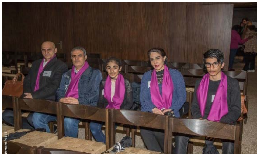
Catéchumènes en formation

Le Service cantonal a accompagné une personne vivant une situation particulière. Cette expérience a suscité une nouvelle collaboration avec la Pastorale des Milieux Ouverts. Le témoignage de cette personne nous a rappelé le sens et l'importance de l'appel, la vocation ou mission de chaque baptisé, sans oublier le pardon et la réconciliation.