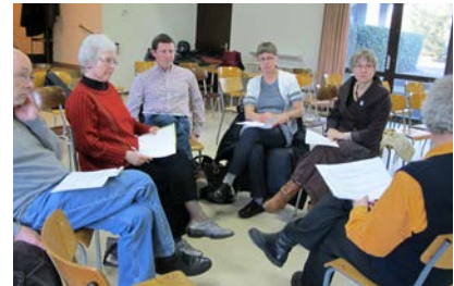
Atelier Œcuménique de Théologie