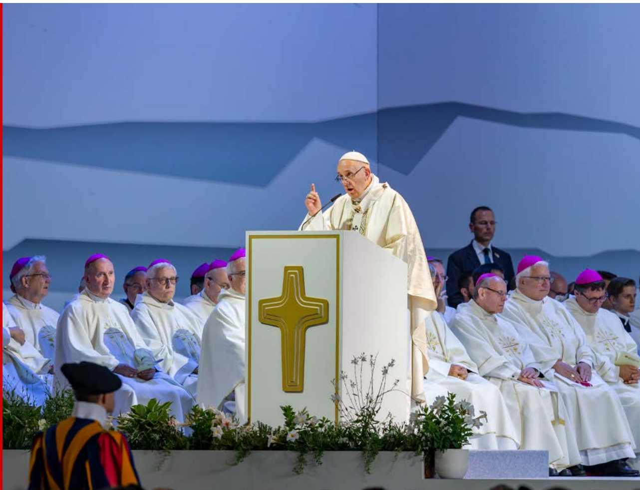
Homélie du Pape François à Palexpo le 21 juin