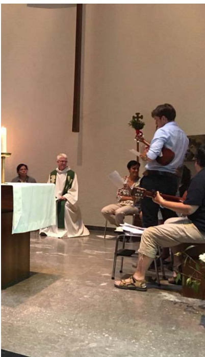
Messe en musique avec les jeunes

Les mots clé de l'aumônerie : accueillir, écouter, partager, accompagner. L'icône biblique de référence est le récit des disciples d'Emmaüs.