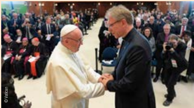
François et le Révérend Olav Kykse Tveit, secrétaire général du Conseil Œcuménique des Eglises (COE), le 21 juin dernier.

Plus de 37'000 fidèles ont accueilli le pape François lors de la messe à Palexpo le 21 juin dernier, un moment fort de célébration, au terme d'une visite du Saint-Père à Genève placée sous le signe de l'œcuménisme et donc des efforts pour la promotion de l'unité des chrétiens.