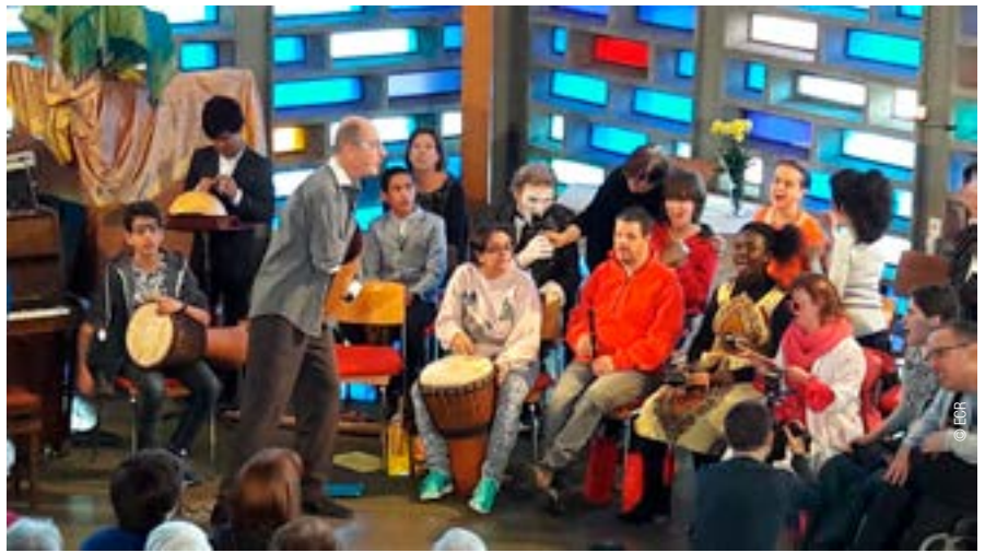
En 2017, le projet musical Tumbadora de la COPH a célébré lors d'un spectacle la joie de l'harmonie dans la diversité.

Elle est présente de manière permanente à Champ-Dollon, Curabilis et à La Brenaz ainsi qu'à la demande dans les établissements de semi-liberté et pour mineurs. Dans le délicat contexte carcéral, elle apporte la sécurité d'un lien relationnel permettant aux personnes