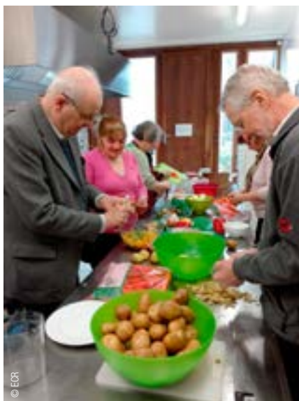
A l'Oasis les repas sont préparés et partagés ensemble.

Les Aumôneries protestante et catholique de l'Université sont officiellement réunies depuis l'an 2000. Située dans une des arcades d'Uni-Mail et animée par une religieuse et un pasteur, l'Aumônerie de l'Université est un espace œcuménique d'accueil et d'écoute. Elle propose régulièrement des activités favorisant la rencontre humaine (repas, sorties, temps de recueillement, chœur gospel, voyages...), ainsi que des entretiens individuels. Elle est ouverte à tous les acteurs de la vie universitaire, dans le plein respect de leur situation comme de leurs convictions spirituelles et de leur confession ou religion.