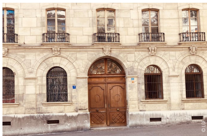
Situé rue de Lausanne 86, à Fribourg, le bâtiment de l'évêché a été construit entre 1842 et 1845