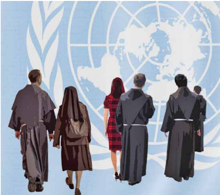
Logo de la publication fêtant les trente ans d'activités de FI à l'ONU.

Grâce à son statut consultatif, Franciscans International a pu soutenir les Franciscains du Bénin en documentant les cas et porter le sujet devant l'ONU. Grâce à ce plaidoyer, d'autres états membres ont appelé à l'action. Cette pression a notamment