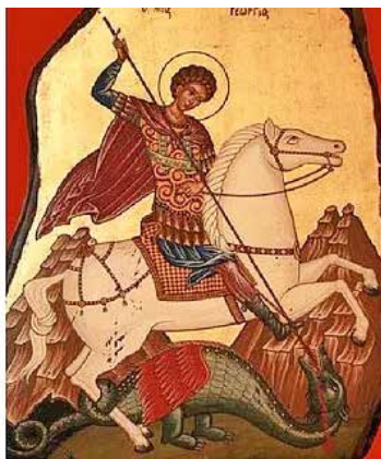
Les saints patrons des églises, monastères et chapelles de Brême.

Ce lexique œcuménique offre des informations complètes sur les saints, les bienheureux et les vénérés des différentes confessions chrétiennes, aussi bien de l'Eglise catholiques et orthodoxes que ceux des Eglises d'Orient – arménienne, copte, éthiopienne orthodoxe et assyrienne – sans oublier les personnalités vénérées dans les églises protestantes et anglicanes. De cette manière, il propose un aperçu de la tradition chrétienne