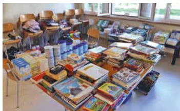
Réception des dons à Montbrillant.