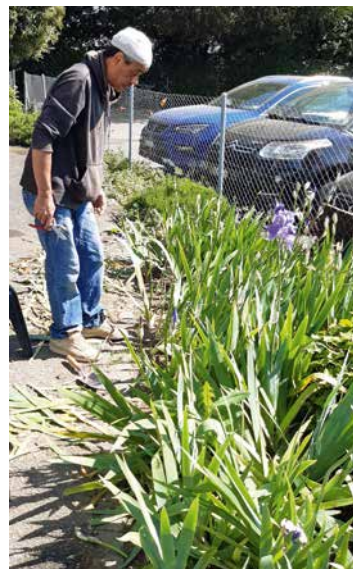
Le jardinage apporte un peu de détente.