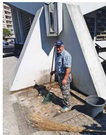
Un coup de balai et c'est propre, en ordre!