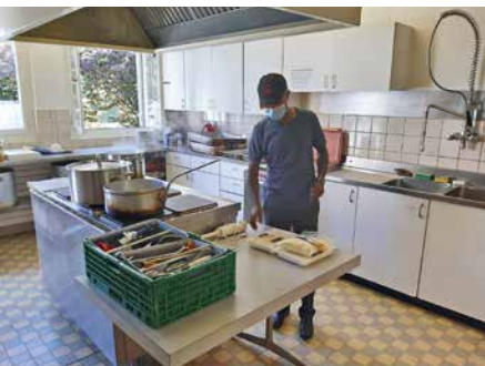
La cuisine: les marmites bouillent pour midi.