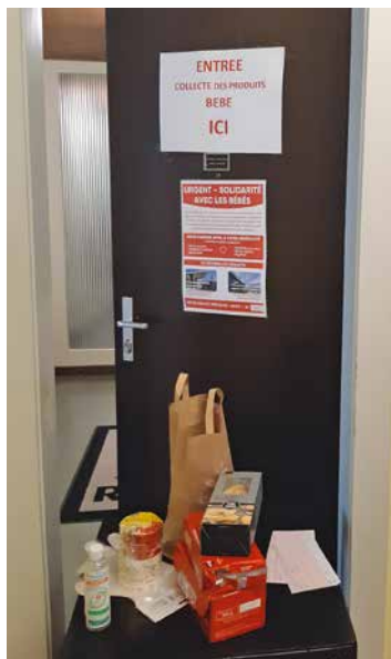
Paroisse Sainte-Clotilde: collecte de produits, c'est ici!

Contact pour les dons: Paroisse de Montbrillant (Rue Baulacre 16, Inès Calstas, 076 384 74 92) et paroisse Sainte-Clotilde (Avenue de Sainte-Clotilde 14bis, Sandra Golay, 079 559 35 40).