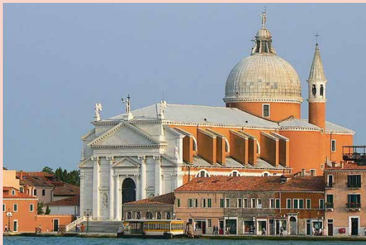
L'église du « Redentore », Venise.

La « Festa del Redentore » c'est la fête de la vie, la fête de Venise qui a survécu à l'épidémie qui tua près de 60'000 Vénitiens malgré les mesures de précaution prises pour l'endiguer.