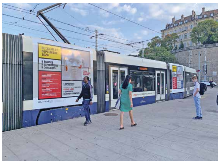
Campagne pour l'exposition L'Homme debout sur les TPG.