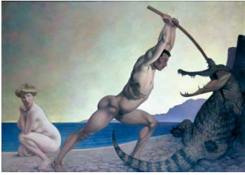
Félix Edouard Vallotton, Persée tuant le dragon, 1910. Huile sur toile, 160 x 168 cm. inv. 1974-0012.