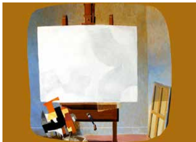
« La toile blanche. » Arcabas

Arcabas est le pseudonyme de Jean-Marie Pirot, un peintre français considéré comme « l'un des maîtres de l'art sacré contemporain » et bien connu pour son œuvre monumentale dans l'église de Saint-Hugues-de-Chartreuse. Passionné de l'humain et s'inspirant des textes bibliques, « Arcabas peint avec la même dignité une poire et deux pommes ou bien Jésus et deux disciples. A ses yeux, rien n'échappe au mystère. Le plus humain est aussi le plus divin ». (José Mittaz)