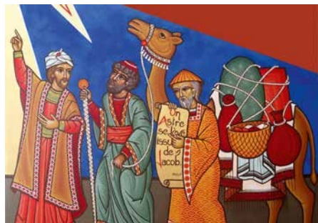
Polyptique de l'Épiphanie.

Renseignements: spiritualite@cath-ge.ch ou 077 441 17 80.