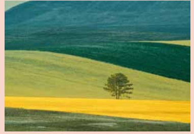
Basilicata, 1978; œuvre de Franco Fontana.